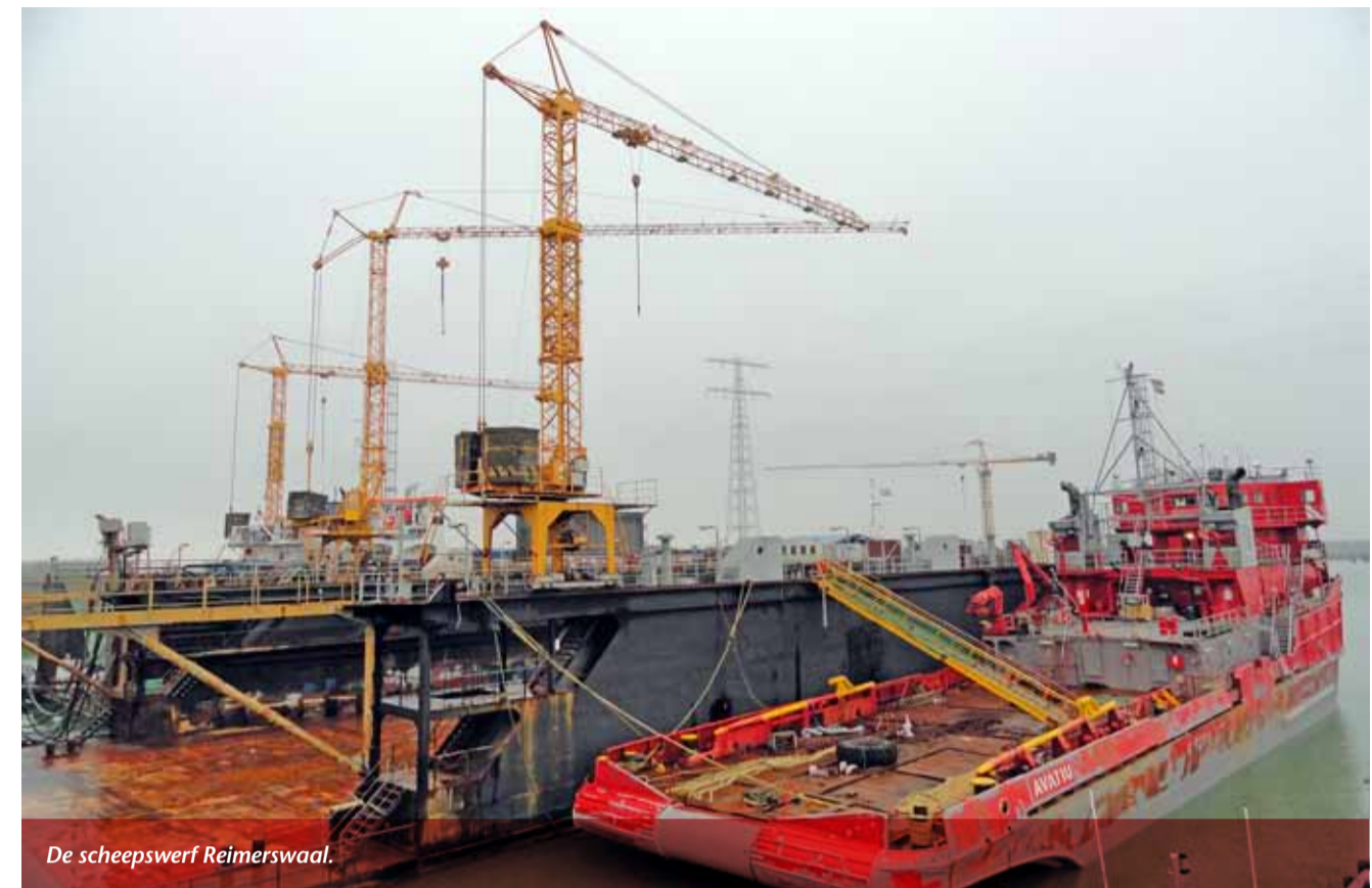
De scheepswerf Reimerswaal.

Volgens Rudi Pieters, eigenaar van de scheepswerf, zal er in de buitenhaven minder geluidsoverlast zijn dan op de huidige locatie omdat er een dijk en snelweg tussen de buitenhaven de woningen liggen. Hij vergeet daar gemakshalve bij dat bij hoog water de schepen verder boven de dijk uitkomen dan op de huidige locatie. Dat de snelweg toch al lawaai maakt en er best nog wat herrie bij kan lijken ook geen goed argument.