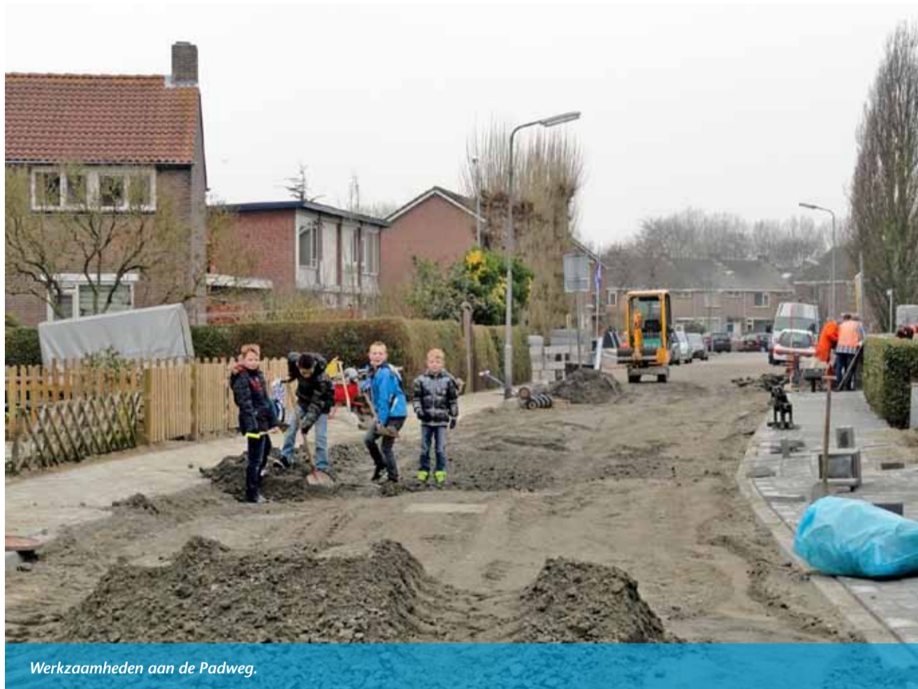
Werzaamheden aan de Padweg.