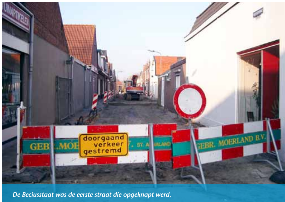
De Beciusstaat was de eerste straat die opgeknapt werd.

De Padweg en de Pieter Louwersestraat zijn of worden op dit moment opgeknapt door Van der Straaten uit Hansweert. In tegenstelling tot sommige andere straten binnen de gemeente worden deze straten zeer vakkundig opgeknapt. Maar dat is natuurlijk logisch wanneer je als aannemingsmaatschappij van der Straaten heet.