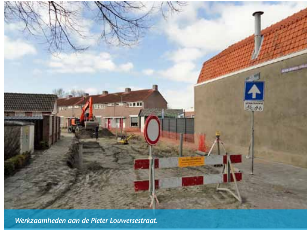
Werzaamheden aan de Pieter Louwersestraat.

“Het achterstallig onderhoud wordt langzaam maar zeker weggewerkt”