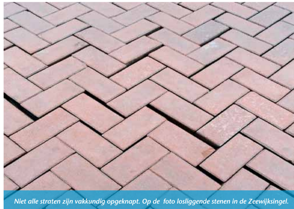
Niet alle straten zijn vakkundig opgeknapt. Op de foto losliggende stenen in de Zeewijksingel.