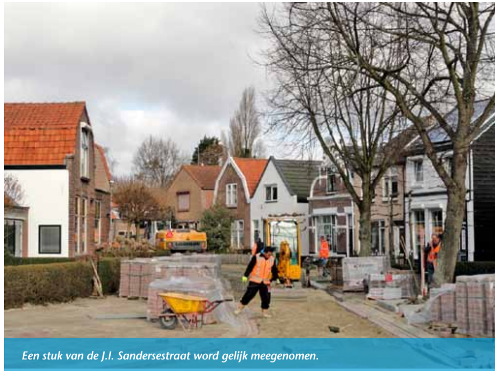
Een stuk van de J.L. Sandersstraat wordt gelijk meegenomen.