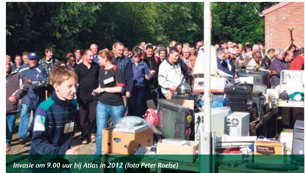
Invasie om 9.00 uur bij Atlas in 2012