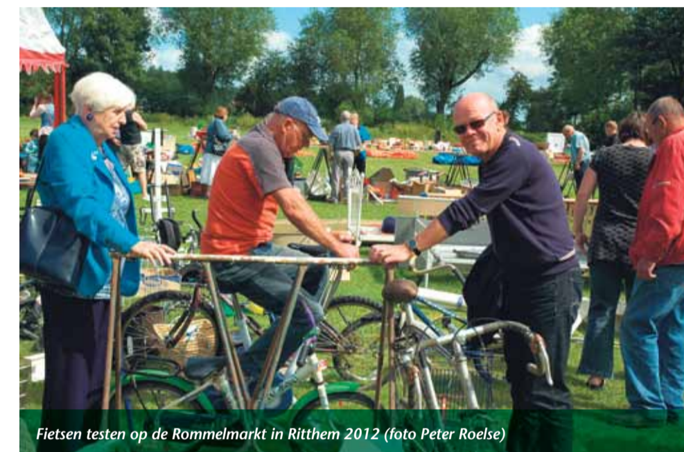
Fietsen testen op de Rommelmarkt in Ritthem 2012

Ik verontschuldig me nog een keer voor mijn onverwacht bezoek, wens ze veel succes met de voorbereidingen en loop huiswaarts. Ik weet dat het gezegde "Een goed begin is het halve werk" hier ook van toepassing is. Het gaat helemaal goedkomen. Nu nog duimen voor droog en zonnig weer!