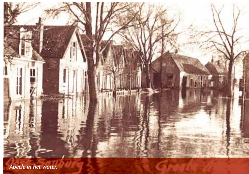
Abeele in het water.