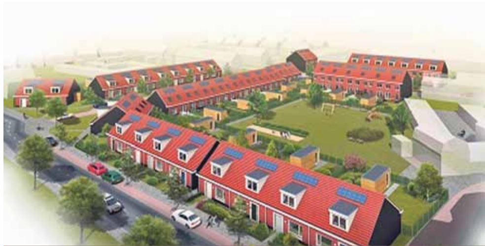
Oost-Souburg op zijn mooist in Hof Kromwege.

Onder de titel "Werk in uitvoering" brengt de Souburgsche Courant de komende tijd telkens een project in de dorpen onder de aandacht, waar een belangrijke bijdrage wordt geleverd aan de kwaliteit van ons leefgebied. Het eerste onderwerp daarin is de herontwikkeling van de wijk rond Dorpshuis "De Zwaan", bij het begin van het project "Hof Kromwege" gedoopt.