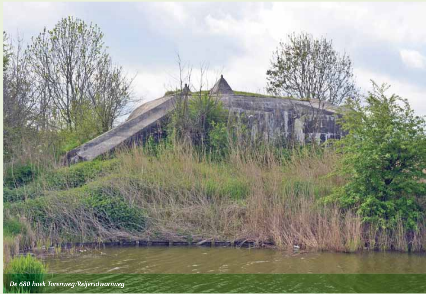
De 680 hoek Torenweg/Reijersdwarsweg

Het is een verdedigingslinie van ongeveer 15 kilometer lang tussen Groot-Valkenisse en Fort Rammekens. De linie was voorzien van een anti-tankgracht, bunkers, een anti-tankmuur en zogenaamde drakentandversperringen. Het geheel moest een mogelijke aanval vanuit de landzijde op Vlissingen voorkomen. Niet dat deze havenstad zo