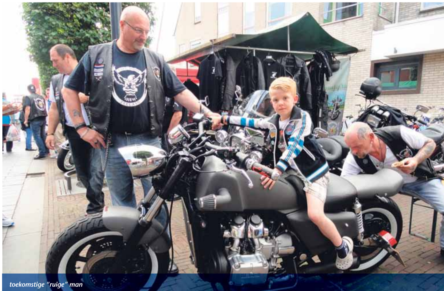
toekomstige "ruige" man

MTC (Motor Tour Club) FreeBirds is op 10 mei 2011 opgericht en hebben inmiddels al ruim 40 leden m/v. De Souburgsche tour club is daarmee de grootste motortourclub in Zeeland. Jaarlijks organiseren ze een of meerdere evenementen waarbij iedereen welkom is. De eerste Zeeland Tour sinds hun bestaan was in 2011. Dwars door Zeeland met toen nog een kleine club en afsluitend een live optreden en een BBQ. Na twee jaar is de opkomst ruim verdubbeld en treden er maar liefst 4 live bands. Dit jaar zal het deelnemersaantal nog verder stijgen. Vanwege de gezellige onderlinge sfeer, de mooie tochten en de knallers als afsluiting. Samen staan ze voor gezelligheid en verdraagzaamheid, en dat wordt ver in de omtrek gehoord. Mond op mond reclame werkt daarbij altijd nog het beste. Zaterdag 13 juni zal het startschot om 13.00 uur te horen zijn op de Karolingenburght en zullen de vele Motoren en Trikes aan hun tocht beginnen. Na afloop zal er op de Karolingenburght live muziek te horen zijn. Raiders of the lost Rock zullen vanaf 16:00 uur optreden en aansluitend zal Echosonic om 18:00