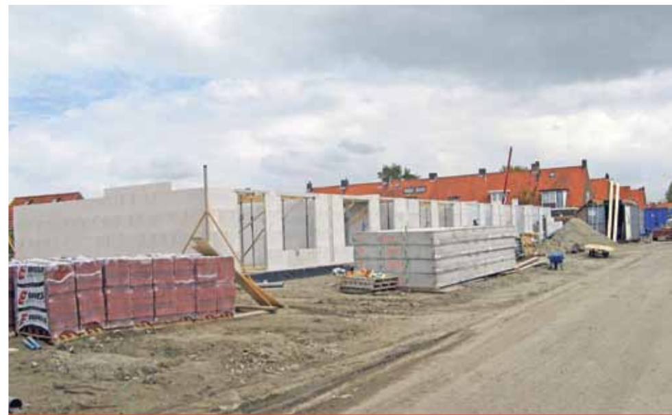
Levensloopwoningen VanTurnhoutstraat in aanbouw.