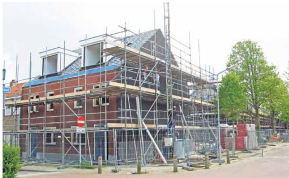
Gezinswoningen in aanbouw.