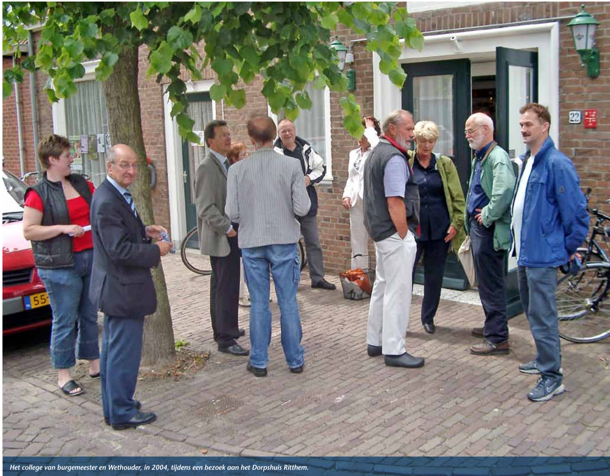
Het college van burgemeester en Wethouder, in 2004, tijdens een bezoek aan het Dorpshuis Ritthem.

In Ritthem staat in de Dorpsstraat het dorpshuis Ons Dorpsleven. In het dorp spreken we altijd over "ons" dorpshuis, immers dat hebben we gekregen. Maar wat hebben we nu gekregen, wanneer hebben we het gekregen en van wie? En wat klopt er van het verhaal dat de gemeente Vlissingen het pand 100 jaar in haar bezit moet houden omdat dit vast zou liggen? En waar zou dit dan vast liggen? Tijd om de archieven in te duiken.