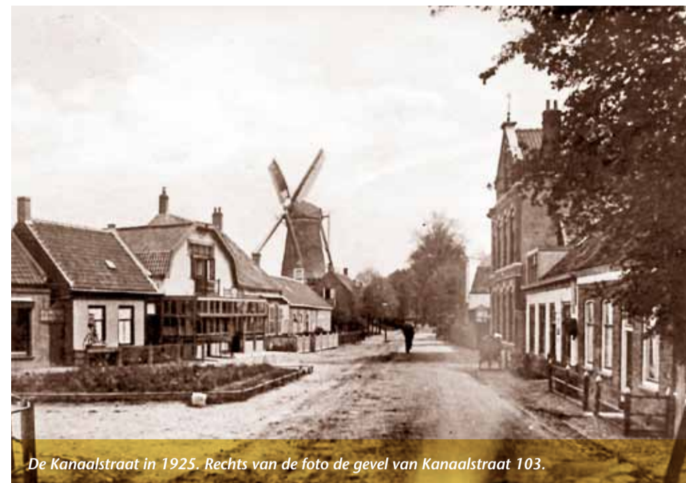
De Kanaalstraat in 1925. Rechts van de foto de gevel van Kanaalstraat 103.