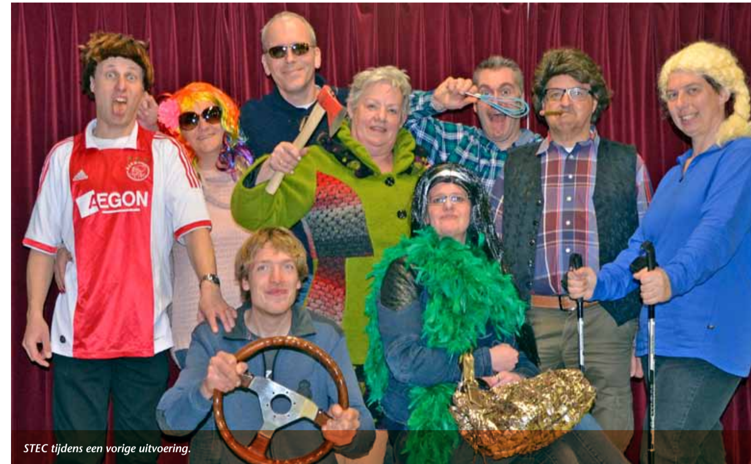
STEC tijdens een vorige uitvoering.

Als Morgiana bezoek krijgt van een zakenrelatie (Hanly, die ze ook persoonlijk erg leuk vindt) vraagt ze Casey om voor haar dochter te spelen. De vriend van Casey, Franklin, komt echter ook op bezoek. Verder wordt Casey ook opgezadeld met een oude schoolvriend Barney, die een opsporingsambtenaar is van de belastingen is en die haar appartement als uitvalsbasis wilt gebruiken. Dit omdat er een belastingontduiker in de flat woont. Aangezien Franklin en Hanly niet mogen weten wat Barney doet wordt hij voorgesteld als de broer van Casey. Om de chaos compleet te maken krijgen ze ook nog bezoek van een agent die op zoek