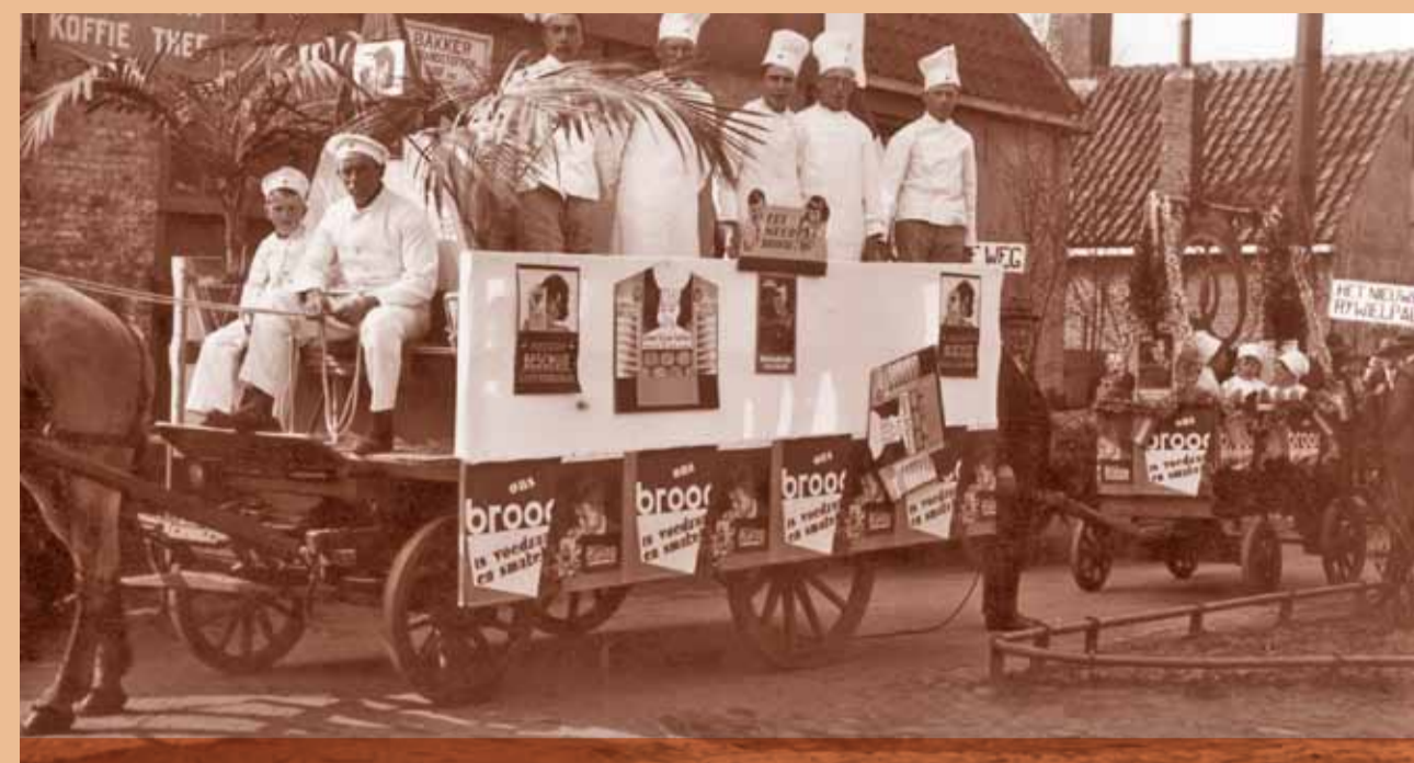
Optocht met praalwagens ter gelegenheid van de opening van het nieuwe rijwielpad

Het is de Souburgers niet ontgaan dat het door de Vereniging Rijwielpad Walcheren in 1926 aangelegde fietspad langs de voet van de duinen van Vlissingen naar Zoutelande een groot succes werd. Twee jaar later ontstond daarom de Souburgse afdeling van deze vereniging om vervolgens een tijdje een slapend bestaan te leiden. Pas in januari 1934 kwam de afdeling met het idee om een rijwielpad aan te leggen langs de Oude Vlissingeweg van Vlissingen via Oost-Souburg en Abeele naar Middelburg. Het idee was geboren maar het ontbrak de Souburgers nog aan financiële middelen en de benodigde grond. Deze oude weg heette vroeger gewoon 'de straatweg van Vlissingen naar Middelburg' en behoorde tot de oudste bestrate wegen van ons land. In mijn artikel over Het