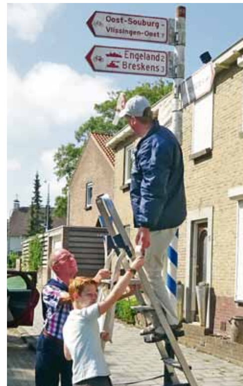
Medewerkers van de Souburgsche Courant helpen de gemeente en plakken een verwijzing naar Engeland weg.