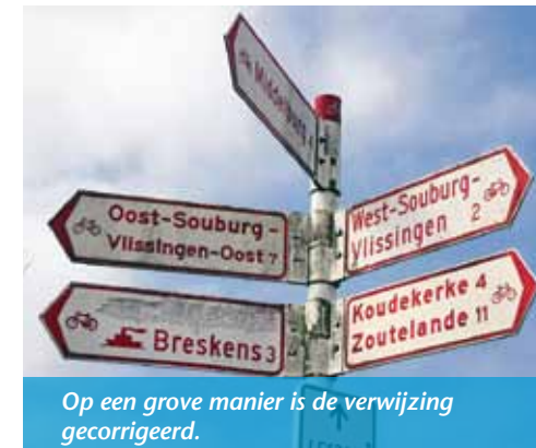
Op een grove manier is de verwijzing gecorrigeerd.

Dit was reden genoeg voor de Souburgsche Courant om uit te zoeken wie de borden schoonhoudt en beheerd. De gemeente gebeld. Daar bleek niemand te weten wie er over ging. Dan maar de ANWB gebeld. Zij konden ons volledig inlichten hoe het met de borden geregeld was. De borden bleken in beheer te zijn bij de gemeente Vlissingen. Zij gaven ons zelfs de naam van de ambtenaar die er overging. Wanneer er borden veranderd moeten worden dan geeft de gemeente dit door aan de ANWB die dan nieuwe borden maakt. De kosten hiervan zijn voor de gemeente. Ook is het mogelijk om de borden met witte band af te plakken.