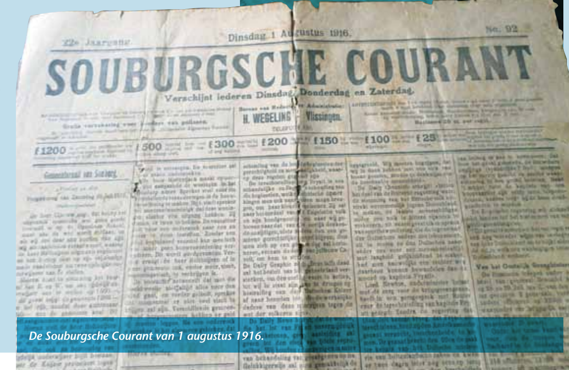
De Souburgse Courant van 1 augustus 1916.