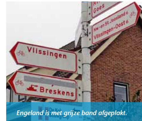
Engeland is met grijze band afgeplakt.