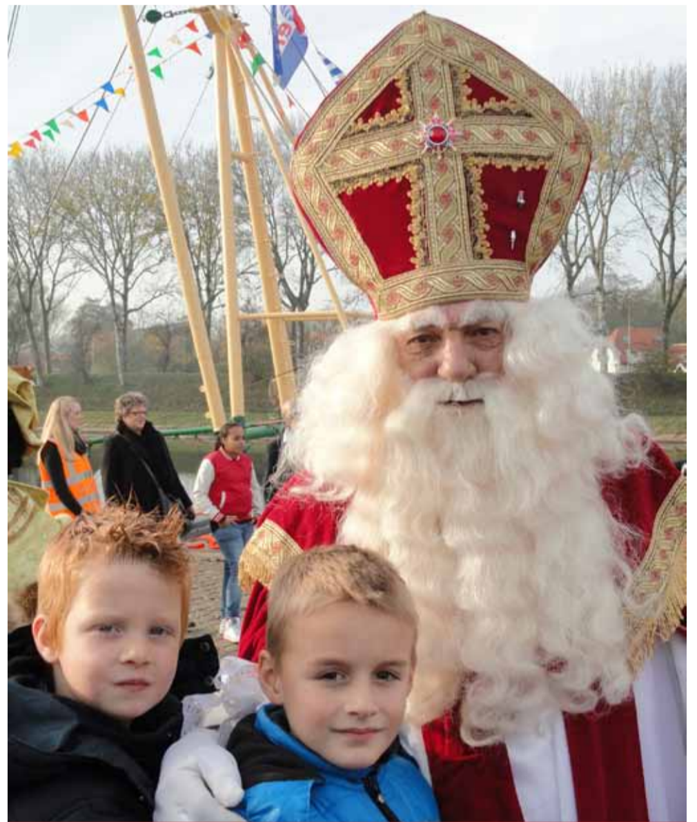
Sinterklaas komt dit jaar maar liefst voor de 50e keer aan in ons dorp.