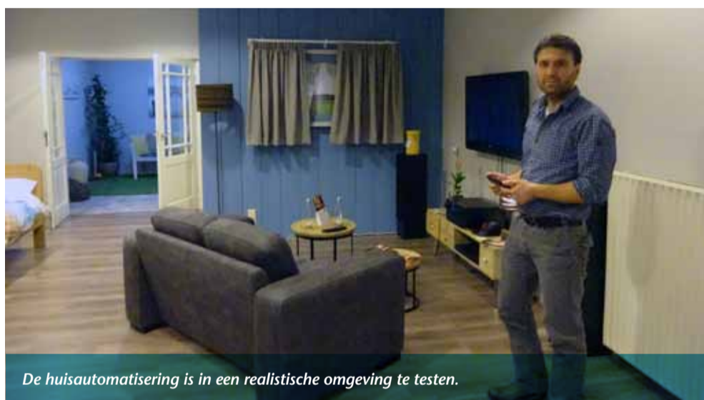
De huisautomatisering is in een realistische omgeving te testen.

Loop je verder door, dan denk je binnen te stappen in de woon- slaapkamer. Het is een praktijkopstelling waar allerlei snuffjes op het