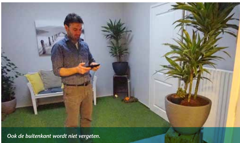
Ook de buitenkant wordt niet vergeten.

De professionele instelling hoeft geen drempele te zijn voor particulieren en dat blijkt: Naast ondernemers weten steeds meer particulieren het bedrijf te vinden en de producten en diensten te waarderen.