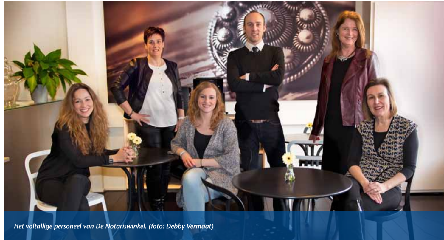
Het voltallige personeel van De Notariswinkel.

Al was er sprake van 25 procent omzetver-