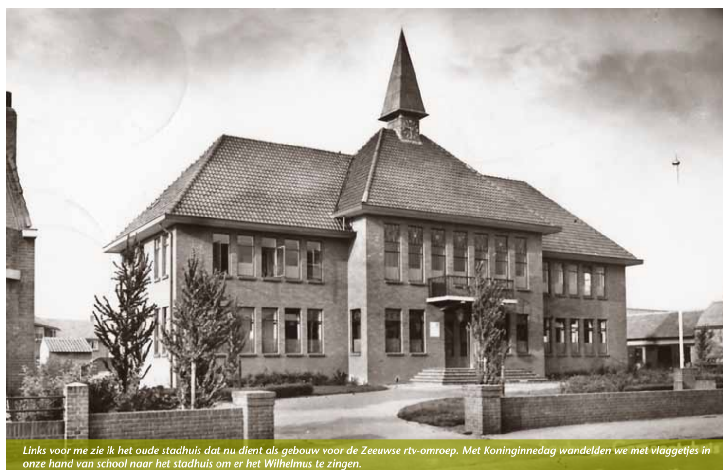
Links voor me zie ik het oude stadhuis dat nu dient als gebouw voor de Zeeuwse rtv-omroep. Met Koninginnedag wandelden we met vlaggetjes in onze hand van school naar het stadhuis om er het Wilhelmus te zingen.