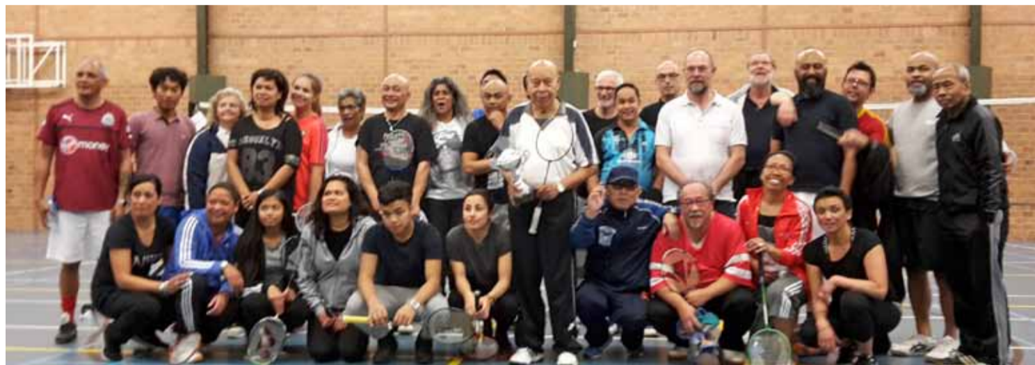
Deelnemers van het toernooi in 2016

In Mae Uku (zaal open vanaf ca. 15.30 uur) hopen we iedereen - in een andere setting -weer te verwelkomen. Gezamenlijk hopen we weer van een heerlijk diner te kunnen genieten met de nodige fotomomenten waardoor we ook dit jaar hopen onze 94-jarige Oom Piet vast te kunnen leggen. We hopen dat u ons allen meehelpt om ook deze 5e editie 'Oom Piet Tuasuun(OPT)-bokaal' tot een succes te brengen. Sporthal De Belt, Koopmansvoetpad 75 in Oost Souburg van 11.00 - 15.00 uur. De Prijsuitreiking is ca. 16.30 uur met aansluitend warme hap in Mae Uku, Prins Hendrikstraat 35A -in de Molukse wijk - te Oost Souburg. Inschrijven voor 4 april 2017 via Onny Tuhuleruw (06 45581027), via Elsa van Garsel-Titaleij (06 24289298) of per email naar stichting@mae-uku.nl. Na inschrijving s.v.p. tegelijkertijd uw deelname (incl. warme hap) ad 7,50 euro p/p over te maken op iban: NL12RABO 01544 75 831 t.n.v. Stichting Mae Uku o.v.v. 'OPT-2017 - naam/namen'.