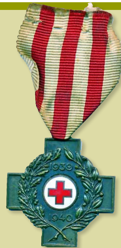
De medaille die Willem Boogaard in 1940 ontving "Voor trouwen dienst".

Onderhoud met de gemeentebesturen over het voedselvraagstuk. Brood gehaald bij de