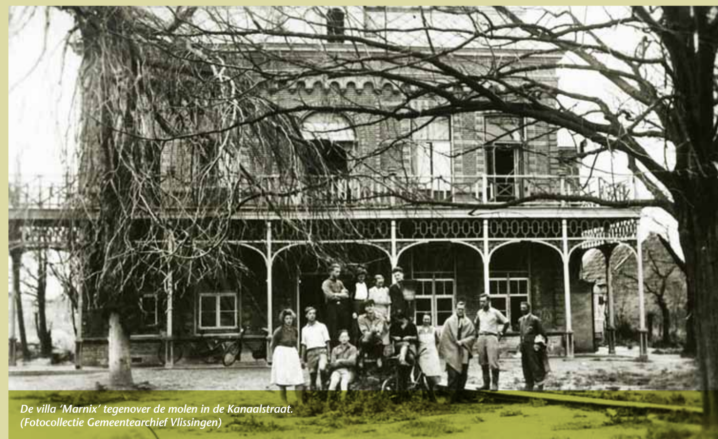
De villa 'Marnix' tegenover de molen in de Kanaalstraat.