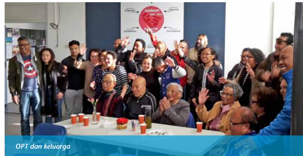
OPT dan keluarga

Vorig jaar werden er 6 rondes gespeeld van 15 minuten. Met 7 velden en natuurlijk 4 deelnemers per veld hadden we met 28 deelnemers, een complete bezetting. Zo kon er een ruime marge ingeruimd worden (pauzes) voor alle recreanten. Coco Coenen en Elsa