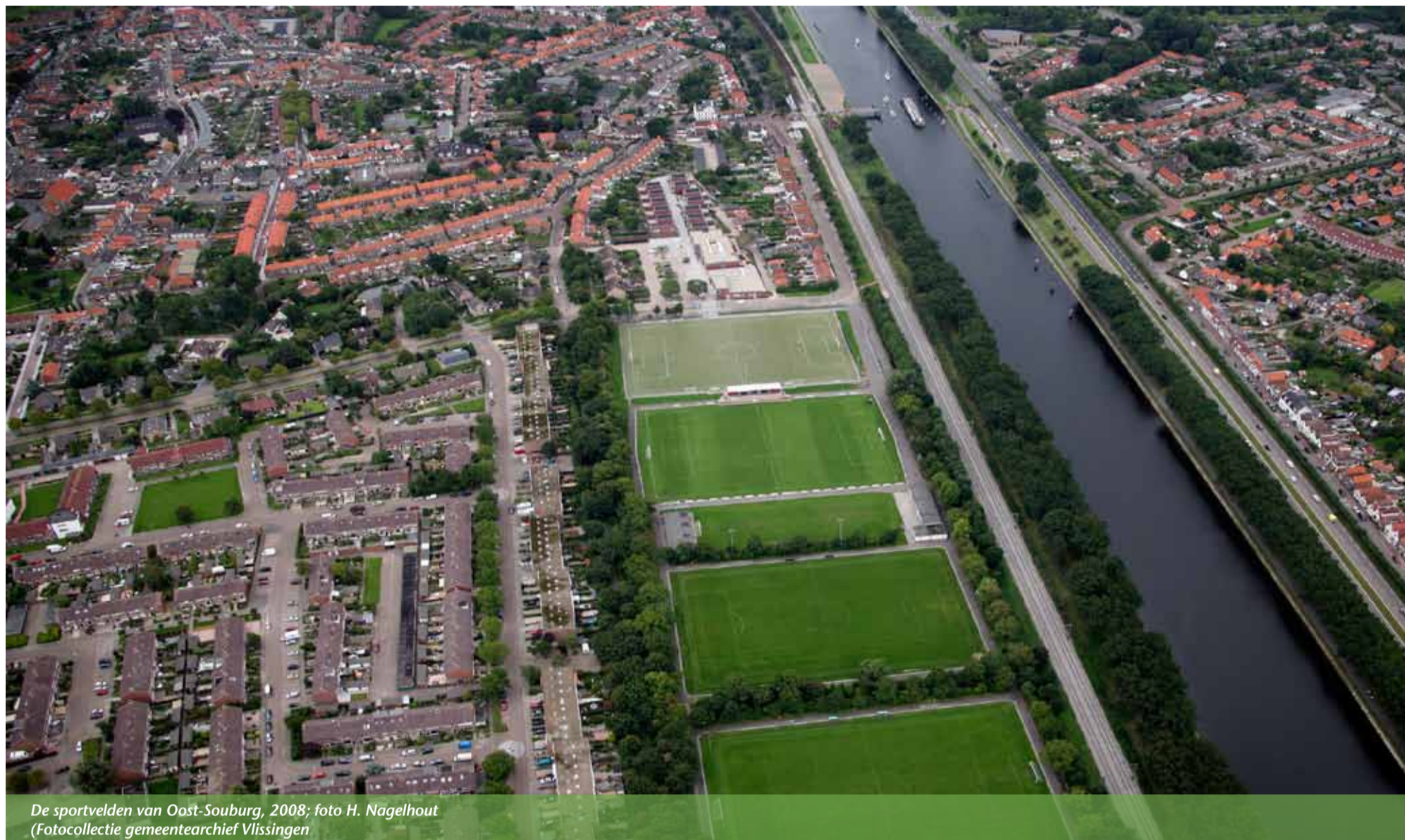
De sportvelden van Oost-Souburg, 2008

Omdat ik vanwege drukke werkzaamheden mijn onderzoek naar de geschiedenis van de Souburgse sportvelden niet heb kunnen afronden moet ik me beperken tot deze korte inleiding die ik overigens afsluit met een oproep. Ik had namelijk graag nu het volledige verhaal willen vertellen. Dus ook het verhaal over de sportvelden in ons dorp van voor en tijdens de Tweede Wereldoorlog. Omdat ik over deze periode tot dusver weinig heb aangetroffen in de annalen moet ik me beperken tot het plaatsen van deze fraaie luchtfoto met een bijpassend onderschrift.