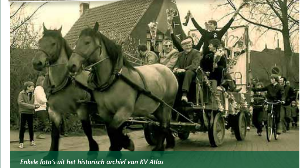
Enkele foto's uit het historisch archief van KV Atlas

16.00 uur vond er een receptie plaats voor o.a. sponsoren en andere korfbalverenigingen. Om 17.30 uur was er een demonstratiewedstrijd van Atlas I tegen oud-Atlas I gehouden. De dag werd afgesloten met een spetterend eindfeest met DJ Richtig.