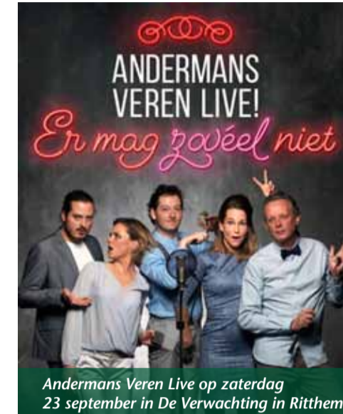
Andermans Veren Live op zaterdag 23 september in De Verwachting in Ritthem