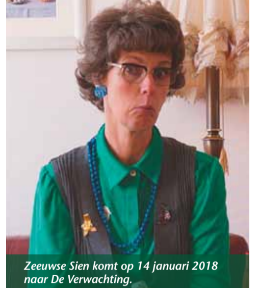
Zeeuwse Sen komt op 14 januari 2018 naar De Verwachting.

Wanneer u vriend wordt van de stichting voor € 25,00, steunt u daarmee niet alleen de activiteiten van de stichting, maar geniet u bovendien van vele kortingen op voorstellin-