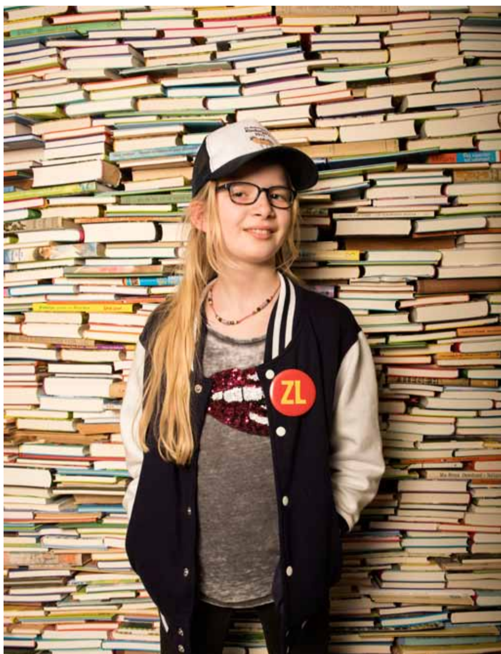
Puk probeert volgend jaar net zo veel boeken te lezen als nu.