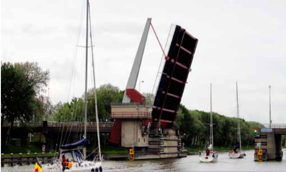
Een hoge brug, waar ook zeilboten met hun hoge masten onderdoor kunnen varen, is al snel drie keer zo hoog als de huidige Sloebrug.

September 2017 - verschijnt sinds 1894 -