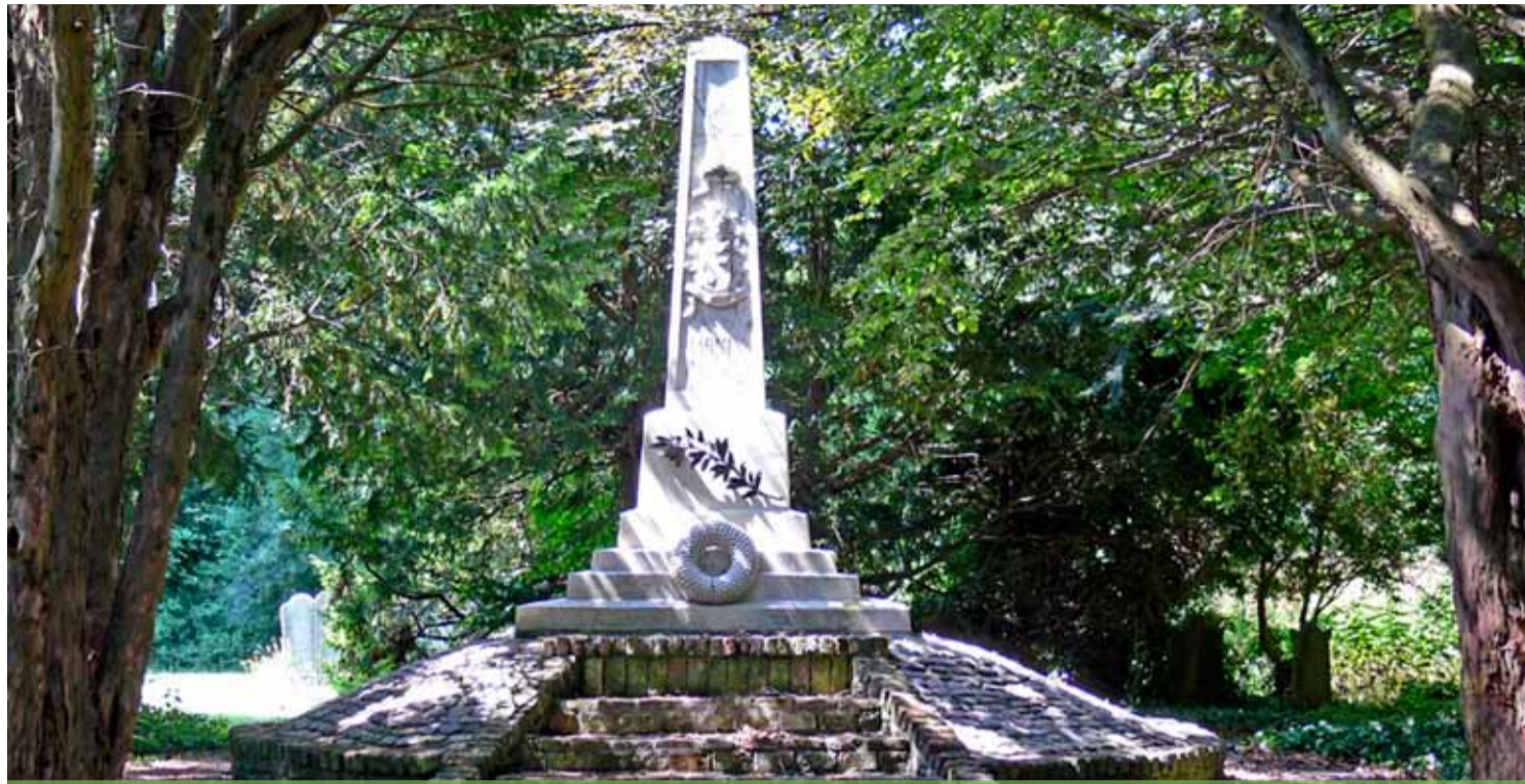
Het monument voor Marnix van St. Aldegonde. Om dit monument te vinden zult u wel uw uiterste best moeten doen. Het monument is verstopt achter het Marnixplein te West Souburg.

Wie op station Vlissingen Souburg uitstapt, ziet voor zich een rommelige Kanaalstraat met kleine huizen. Arbeiderswoningen, gebouwd door scheepswerf 'de Schelde'. Je hebt veel fantasie nodig om je voor te stellen dat hier eens de Spaanse keizer overnachtte bij de schrijver van het Wilhelmus. En niet alleen Marnix was here. De schrijver van dat andere Nederlandse volkslied ('Wien Neerlands bloed in d'aadren vloeit') had iets met Souburg: hij trouwde hier. En nog weer later werd de schrijver van bekende nationale liederen als 'Waar de blanke top der duinen' hier geboren. Ongeveer alle volksliederen hebben dus hun basis in dit volkse buurtje.