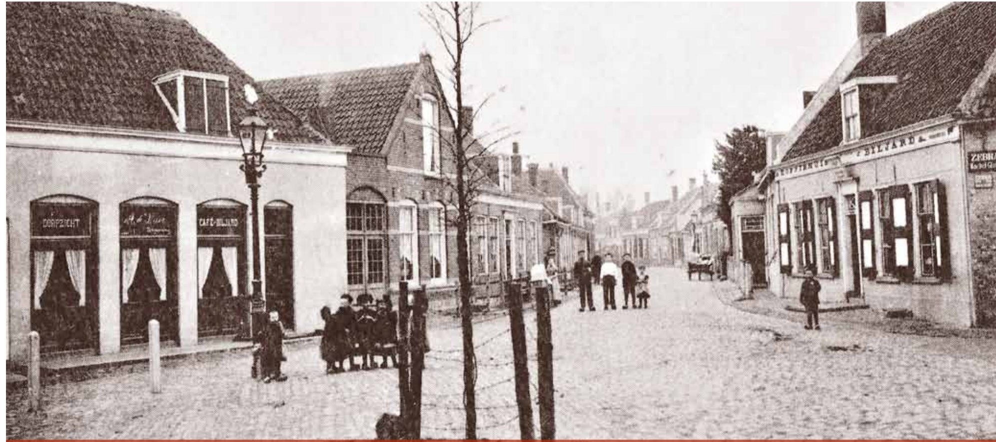
Rechts het koffie huis van Mabilot, circa 1915