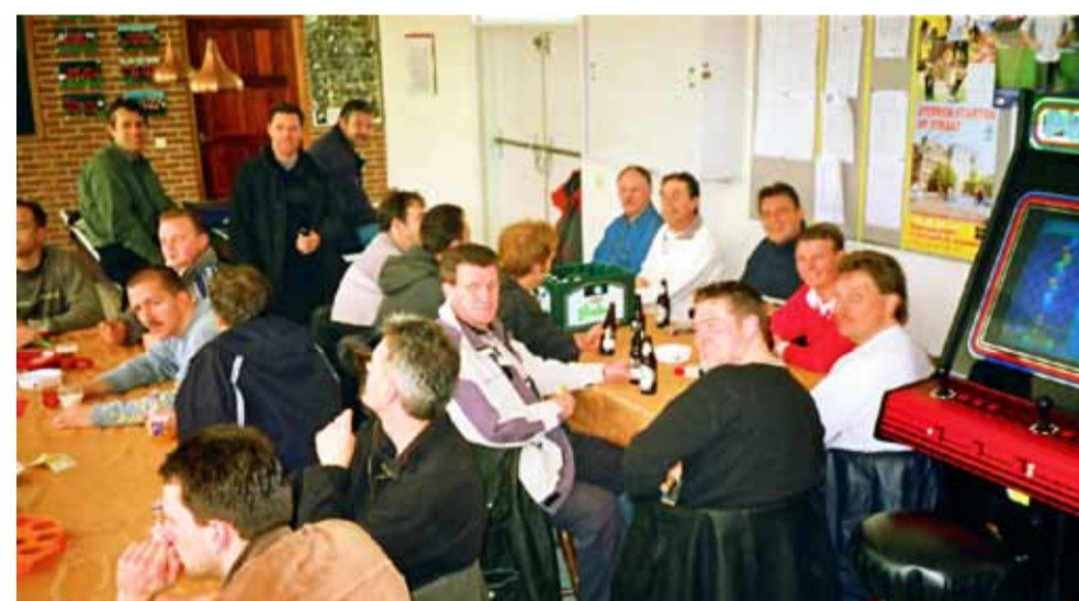
Er werd meteen een onderzoek ingesteld. Het zesde elftal van RCS, net aan zijn derde helft begonnen, werd langdurig onderworpen aan een kruisverhoor. Zonder resultaat echter.