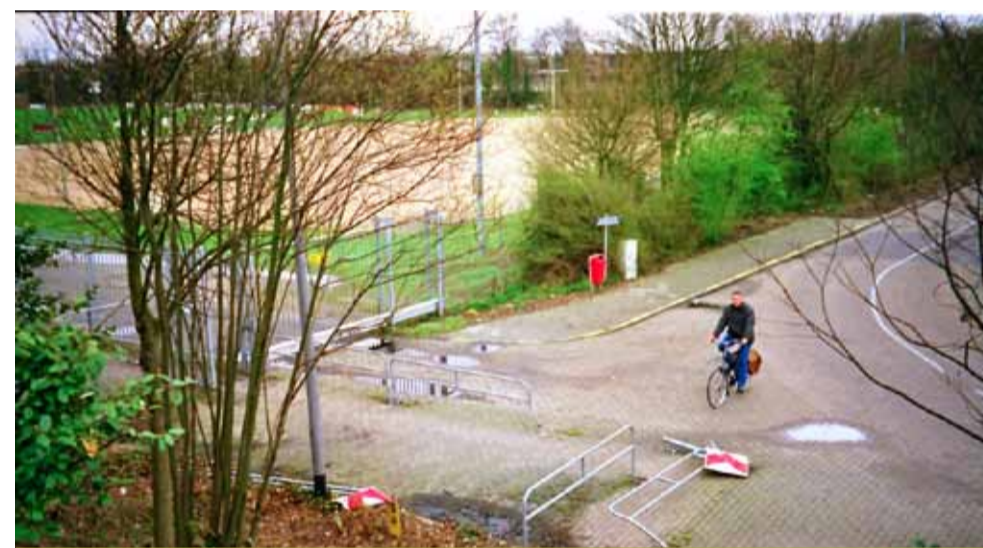
Rinie Eversdijk een RCS lid ontdekt de beschadiging.