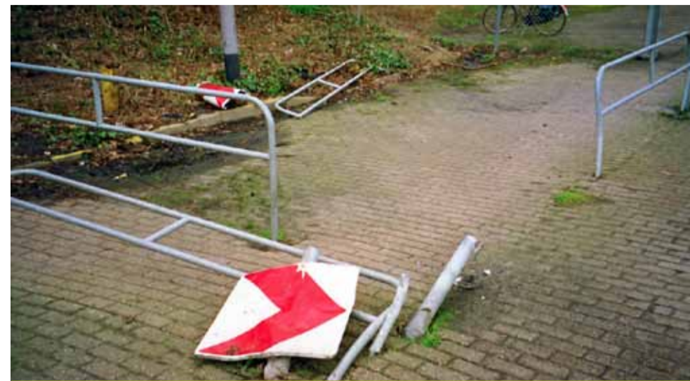
De vernielde hekwerken.

geluk bij een ongeluk. Overdag is het een druk punt waar veel kinderen lopen. Ondanks een diepgaand onderzoek werd de dader niet gevonden. We zullen maar denken beter de dader op het kerkhof dan een slachtoffer. Onderstaand een verslag van het onderzoek.