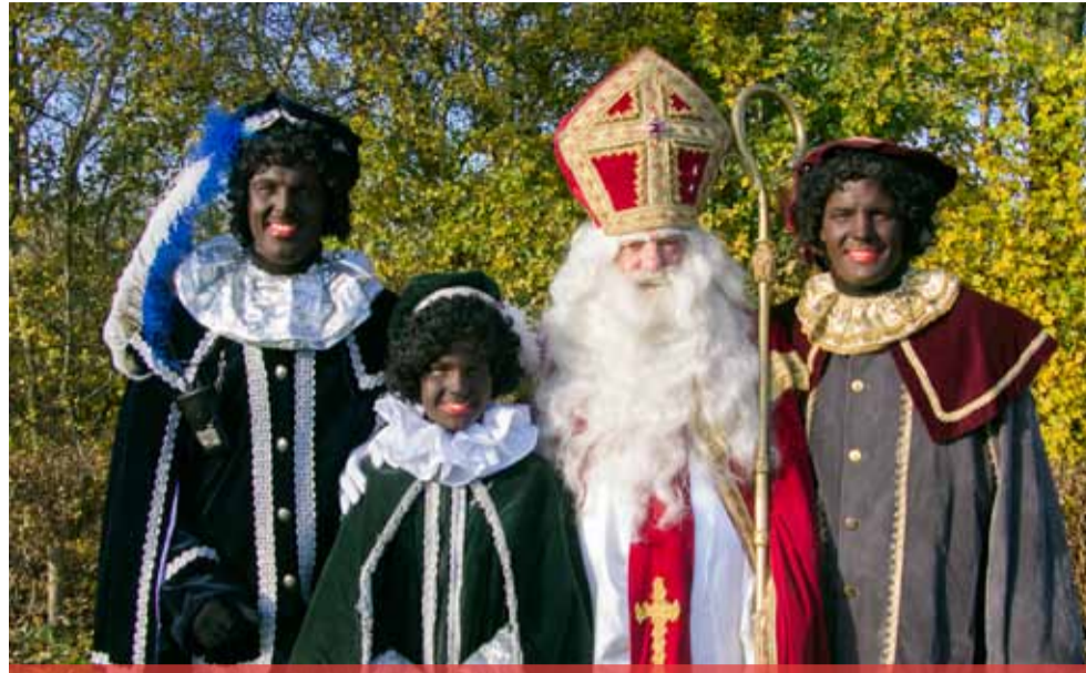
De Sint met zijn Pieten familie, (foto Martien de Looff)

Vanaf open zee komt via Vlissingen het kanaal door. Onder begeleiding van de kapitein en zijn matrozen laat hij zich mede door de vaarpieten veilig door de bruggen van het Kanaal door Walcheren varen. Let op: vroege aankomst tijd! De pakjesboot zal dit jaar 11.30 uur aanmeren aan de loskade. Hier zal hij ontvangen- en welkom geheten worden door de Burgemeester van Vlissingen. Sinterklaas zal bijna een uur op de kade blijven om de kinderen te begroeten en tekeningen in ontvangst te nemen. Aansluitend zal hij Americo bestijgen en aan zijn ronde door het dorp beginnen. De muzikale begeleiding zal dit jaar verzorgd worden door de zwarte pieten band van het "dweil en fanfare korps; Jonge kracht en de feest band van "de dikke nekken".