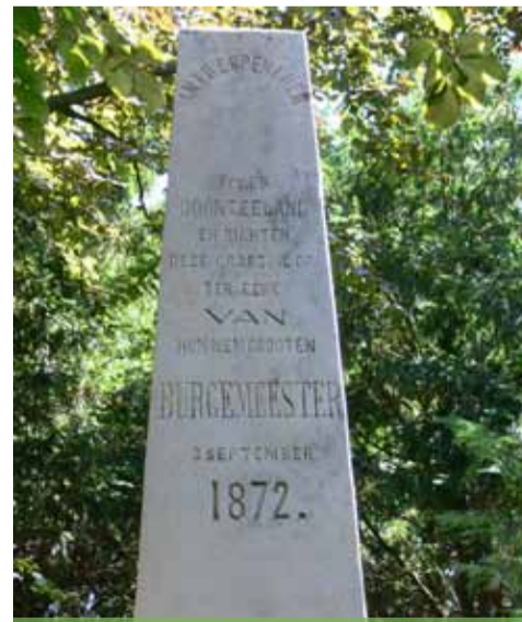
Op de begraafplaats in West Souburg staat een gedenknaald voor Marnix. Opgericht in 1872. Door wie? Niet door de Nederlanders! Die zijn hem bijna vergeten. Maar nota bene door de inwoners van Antwerpen.

(Dit artikel is eerder gepubliceerd in de Souburgse Courant van december 2008.)