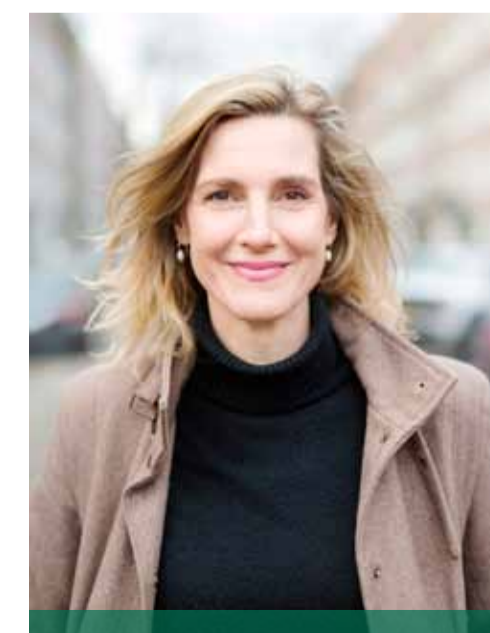
Actrice Elvira Out

Voor het volledige aanbod in De Verwachting: www.theaterdeverwachting.nl Voor het totale aanbod van Theaters aan Zee op alle locaties: www.theatersaanzee.com