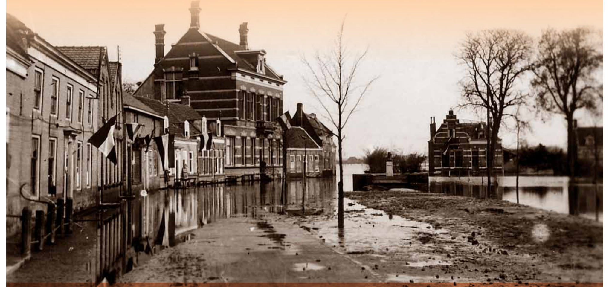
Het Oranjeplein met links de burgemeesterswoning en op de achtergrond Schoonenburg, circa 1945.

Bomenlied en Zeeuws Volkslied werden de oorkondes uitgereikt en - nog belangrijker - de tractatie in de vorm van een taaiop. Tegenwoordig wordt de Boomplantdag jaarlijks in Nederland gehouden op de derde woensdag van maart en heet nu 'Nationale Boomfeestdag'. Door alle gezamenlijke inspanningen en een veerkrachtige natuur kunnen we op Walcheren weer genieten van een prachtig natuurschoon. Niet voor niets is een groot deel van het voormalige eiland inmiddels aangewezen als nationaal landschap.