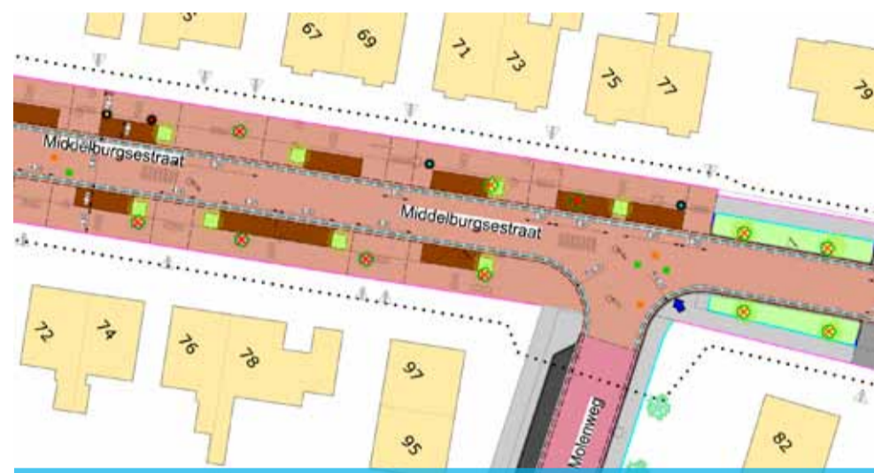
Een gedeelte van de tekening van het voorlopige ontwerp herinrichting Middelburgse straat.

het verzoek om een raadsvoorstel onderhoud straten en wegen voor te bereiden de raad inzicht te geven in de kosten die nodig zijn om het onderhoud op een gewenst niveau in stand te houden. In 2006 komt de grote doorbraak. Zowel het college als de meeste politieke partijen, en dus ook de meerderheid van de gemeenteraad, zien de noodzaak om geld vrij te maken voor het verder wegwerken van het achterstallig onderhoud. Ook wordt er structureel een budget in de begroting opgenomen om te voorkomen dat achterstallig onderhoud in de toekomst niet meer voor komt. De provincie Zeeland ziet toe dat de gemeente zich daar ook aan houdt.