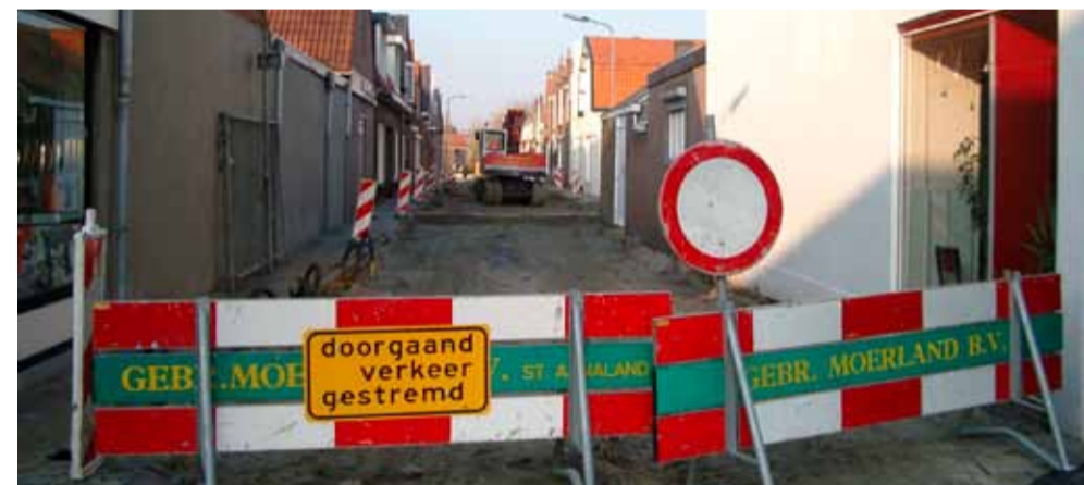
Wegwerken van achterstallig onderhoud aan de eerste elf straten; Beatrixstraat, Beciusstraat, Hudsonstraat, Julianastraat, P.Hendrikstraat(Noord) Regentessestraat, Steenwijkstraat, Van Turnhoutstraat(Oost), Van Visvlietstraat, Vlissingsestraat(stukje), Willem Alexanderstraat(Noord).