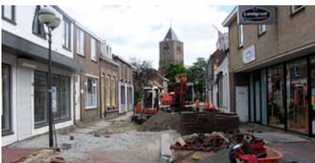
In 2008 is ook de Paspootstraat, Vlissingsestraat en daaropvolgend het Oranjeplein opgeknapt.