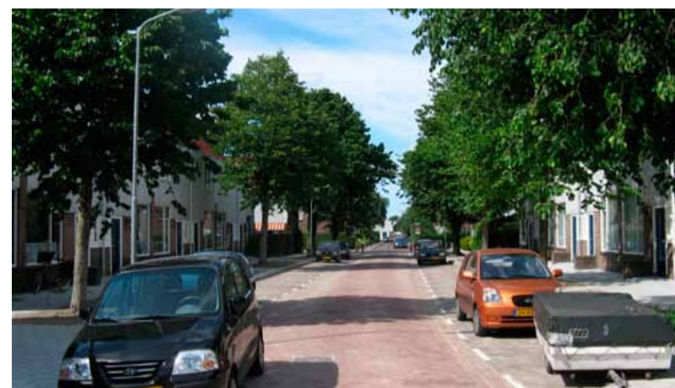
In 2008 wordt De Deckerstraat, Putwijkstraat, Steenwijkstraat, Koopmansvoetpad, Van Teijlingenstraat, stuk Dijkstraat, Zeelandiaplein en de Haaksbergenstraat opgeknapt. De Deckerstraat ligt er weer fraai bij.