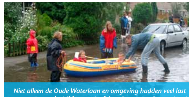
Niet alleen de Oude Waterlaan en omgeving hadden veel last van wateroverlast (Maar wat wil je ook wanneer je een straat Oude Waterlaan noemt.) ook de Burgemeester Stermerdinglaan. De waterproblemen in deze straten zijn inmiddels opgelost.