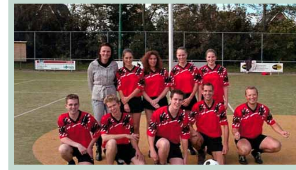
Uit het fotoarchief van Wim de Meij

Twee foto's van Atlas, de eerste uit 1947 (hierboven) en de tweede uit 2017 (hieronder), 70 jaar later. In 2017 ligt er een modern kunstgrasveld en in 1947 werd er gespeeld op een aangestampt stuk landbouwgrond aan de Dorpsweg. Links op de oude foto de boerderij van Jan de Pagter, in het midden Berglucht en rechts de boerderij van Willem Wondergerm.