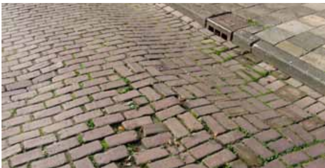
Aan kreupele straten was geen gebrek