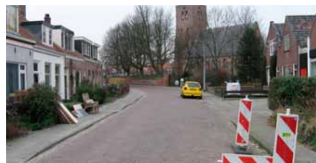
De Ritthemsestraat kende dezelfde problemen als de andere oude doorgaande straten.