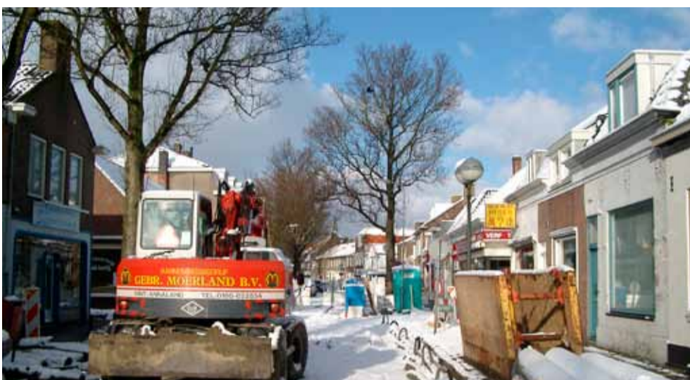
In februari 2004 startte het onderhoud en de herinrichting van de Kanaalstraat. Winkeliersvereniging Nemidso had al in 1996 een brief aan de gemeente geschreven met daarin de wens de hoofdstraat van Souburg op te knappen. De gebroeders Moerland uit Sint-Annaland voeren het werk uit. Een goede keus van de gemeente. Alle straten die door de gebroeders opgeknapt zijn zien er heel goed uit.

Aan 'kreupele' straten geen gebrek in Souburg is de kop van een artikel in de Souburgsche Courant van februari 2003. De courant vervolgt: "Snel verbeteren is zeker geen overbodige luxe, zoals de volgende opsomming aantoonst." En dan volgt er een hele waslijst met slecht onderhouden straten.