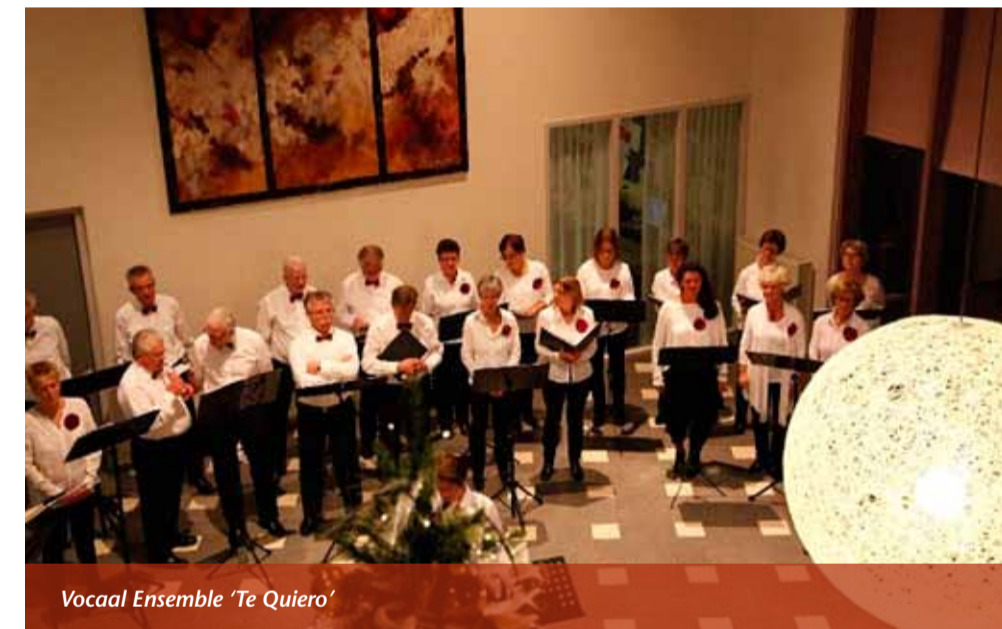
Vocaal Ensemble 'Te Quiero'

De doelstelling van het koor is om samen te zingen en daar met z'n allen veel plezier aan te beleven. Om de kwaliteiten van het koor verder te ontwikkelen worden er door de dirigent waar mogelijk aandacht besteed aan zang- en ademhalingstechnieken en basiskennis van het notenschrift. Dat discipline van de koorleden daarbij noodzakelijk is spreekt natuurlijk voor zich.