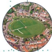
KANAAL DOOR WALCHEREN