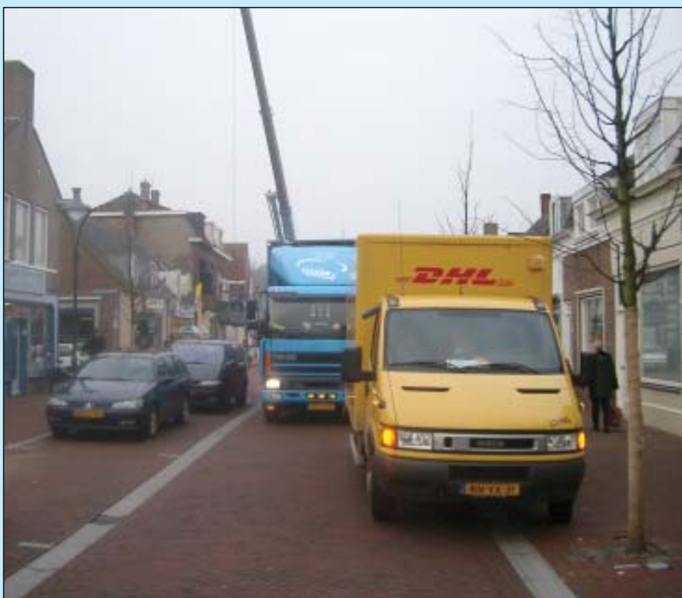
• Bij het laden en lossen versperren vrachtwagens vaak lange tijd de rijbaan

- De invalidenparkeerplaats moet beter aangeduid worden. ■