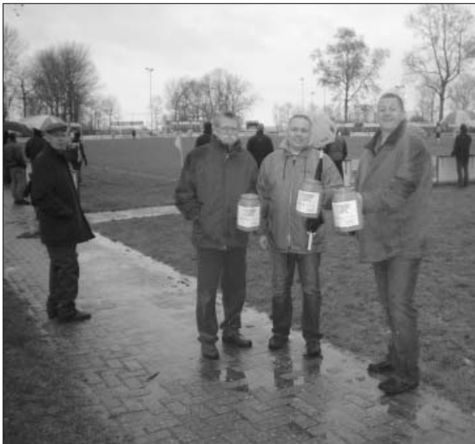
• Ook tijdens voetbalwedstrijden wordt er gecollecteerd voor het goede doel

Tenslotte houdt het Zeeuws Cegelecrunningteam op zaterdag 14 april de inmiddels traditionele Roparunrommelmarkt in de overdekte garage van het openbaar vervoerbedrijf Connexion te Middelburg. Deze garage ligt aan de Kleverkerkseweg/Industrieweg. De rommelmarkt bracht in 2005, 5730.28 euro op en in 2006 7600 euro. ■