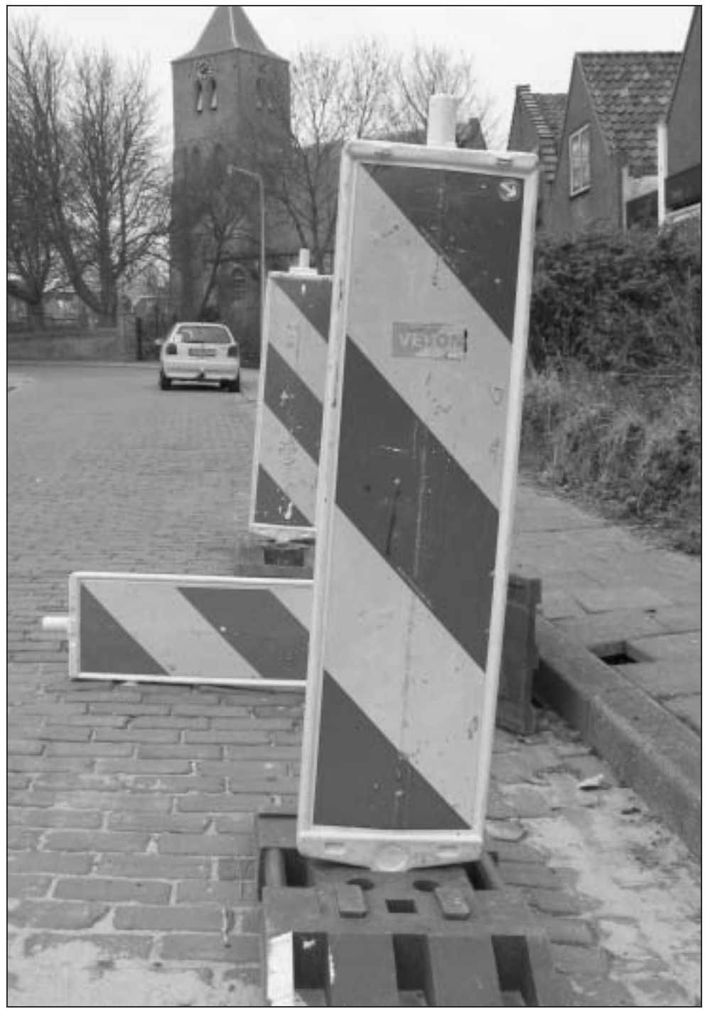
• Er staan al een paar weken pionnen ter hoogte van huisnummer 15. Aan de stoep is duidelijk te zien dat er flink wat zand van onder de tegel is gespoeld.