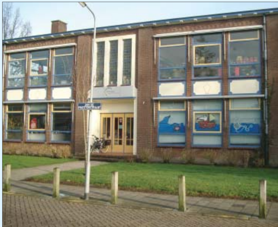
• Basisschool De Tweemaster (voorheen de J.H. van Daleschool) bestaat vijftig jaar. De leiding wil dat niet zomaar voorbij laten gaan. Daarom is er een feestweek in april.

In de latere jaren is er het nodige aangepast aan de binnenzijde en achterzijde van de school. Het gebouw werd geschikt gemaakt voor de basisschool in 1985 en ook de laatste jaren nog werd het gebouw geschikt gemaakt voor bijvoorbeeld het gebruik van