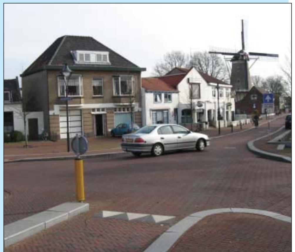
• Vraag Souburgers wat ze het gevaarlijkste verkeersknooppunt vinden in hun dorp en steevast komen ze met de kruising bij het station op de proppen. Vooral fietsers krijgen het daar vaak zwaar te verduren. Er gebeurde zelfs al een dodelijk ongeval.