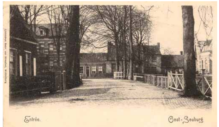
Entree Oranjeplein circa 1905.

Luchtfoto's bevatten in de regel een enorme hoeveelheid informatie. De bij dit artikel geplaatste foto uit 1964 vormt daarop geen uitzondering. Rechts is het bouwrijp gemaakte deel van plan Middenhof zichtbaar met de nog lege Steenwijkstraat. In die omgeving zijn later 23 bungalows gebouwd. Het eerste deel van de Burgemeester Stemerdinglaan liep toen nog niet verder dan de Oudewaterlaan. In 1969 is deze pas doorgetrokken tot aan de Spoorstraat. Op de hoek met het Oranjeplein staat de oude burgemeesterswoning. Ook het tracé van het Noordwegje is nog goed zichtbaar