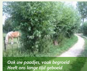
Ook uw paadjes, vaak begroeid Heeft ons lange tijd geboeid