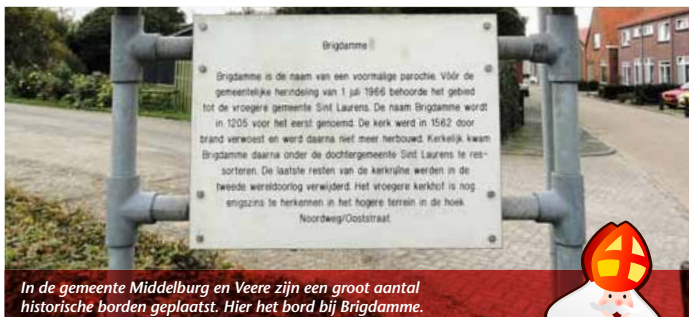
In de gemeente Middelburg en Veere zijn een groot aantal historische borden geplaatst. Hier het bord bij Brigdamme.