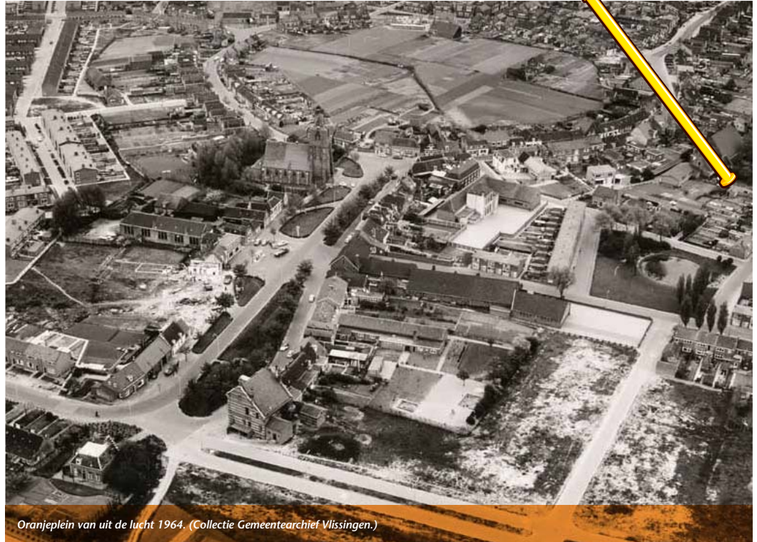
Oranjeplein van uit de lucht 1964.

De gemeente besloot de woning in 1952 van de burgemeester aan te kopen en aan te wijzen tot ambtswoning. Het pand kende toen al de nodige onderhoudsachterstand. Tijdens de oorlog had de woning sterk geleden door de inundatie. Vanwege de zout- en vochtschade ontstonden er na verloop van tijd scheuren in de rookkanalen met als