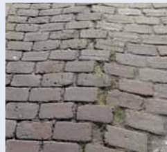
De Pieter Louwerse straat.