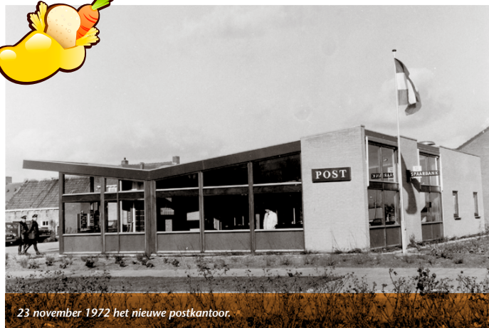
23 november 1972 het nieuwe postkantoor.