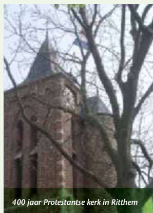
400 jaar Protestantse kerk in Ritthem

de eerste Hervormde diensten werden gehouden zal daar in februari 2012 worden stilgestaan in Ritthem. Een werkgroep vanuit de gemeente is al een tijdje bezig met het programma voor de festiviteiten waarbij het hele dorp betrokken zal zijn. Op 11 en 12 februari 2012 zullen de activiteiten beginnen. U wordt begin volgend jaar uitvoerig geïnformeerd over dit feest.