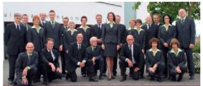
De medewerkers van uitvaartverzorging H. Jobse wensen u een goed en gezond nieuw jaar en fijne feestdagen toe. Zij wensen dat mensen naar elkaar omkijken en niet alleen tijdens deze feestdagen, maar altijd als een ander mens dat nodig heeft.

Zij zijn zich wel bewust dat nazorg en begeleiding na de uitvaart niet mag ontbreken. Daarom willen zij zich juist daarin onderscheiden. Zij weten wat verdriet is en weten ook dat mensen daarin ondersteuning nodig hebben en dat bieden zij. Een aantal keer per jaar besteden wij extra aandacht aan nabestaanden door bijeenkomsten en lezingen.