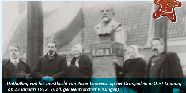
Onthulling van het borstbeeld van Pieter Louwerse op het Oranjeplein in Oost-Souburg op 23 januari 1912. (Coll. gemeentearchief Vlissingen)

Op 23 januari 1912 werd in Oost-Souburg het borstbeeld onthuld van jeugdschrijver Pieter Louwerse (1840-1908). Het is niet overdreven te stellen dat hij de grootste kindervriend van zijn tijd was. Zijn 'geschiedkundige verhalen' voor de jeugd werden verslonden en door de tijdschriften die hij met niet aflatende energie redigeerde (onder andere Voor 't Jonge Volkje), bouwde hij een band op met kinderen uit het hele land. Meteen na zijn tragische dood - hij werd in zijn woonplaats Den Haag overreden door een tram - werden er zowel in Den Haag als in zijn geboortedorp Souburg initiatieven genomen voor het oprichten van een gedenkteken. Ook Koningin