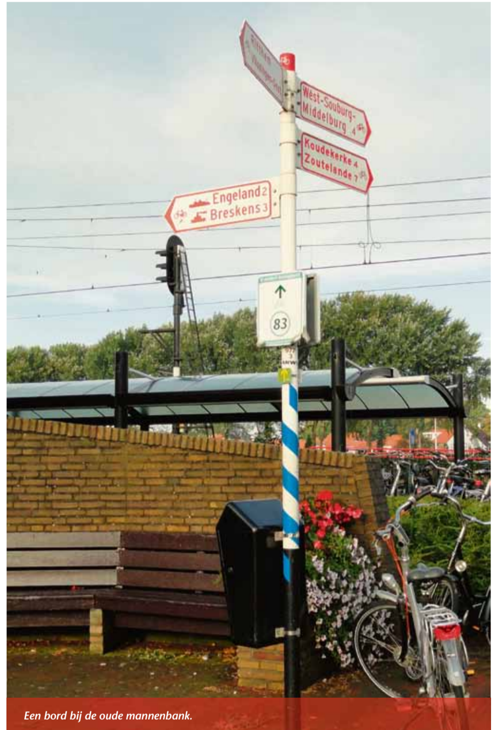
Een bord bij de oude mannenbank.

Met de gemeente is afgesproken dat er geïnventariseerd wordt waar de borden staan en dat daarna de verwijzingen weg geplakt worden. In de volgende Souburgsche Courant hoort u meer.