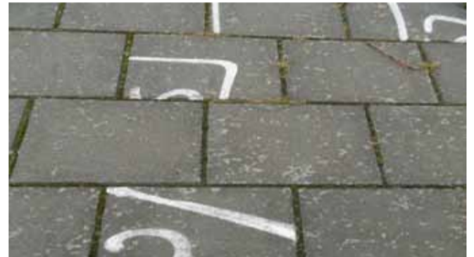
Beschilde stoeptegels zijn niet uit de partij gehaald maar gewoon gebruikt voor de bestrating. Hier bij de ondergrondse container hoek van Steveninckstraat – Zeewijkensingel