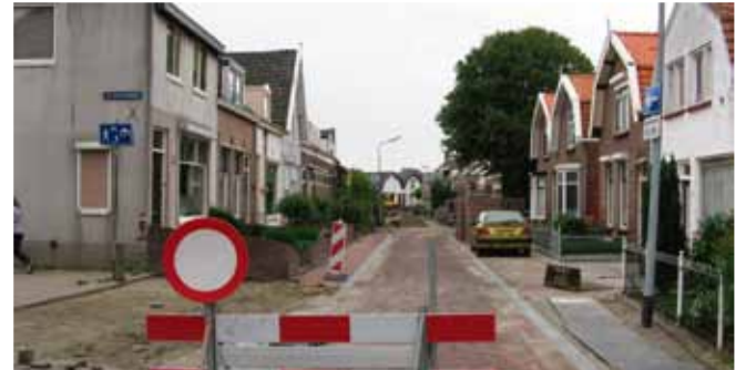
In de J.I. Sandersstraat kun je zien dat er veel kwaliteitsverschil zit in het werk van de verschillende ondernemers. Het duurde lang en er werd slordig gewerkt. Het eind resultaat is mager.