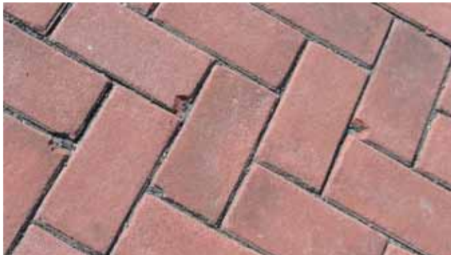
Er is veel breuk in de gebruikte stenen.