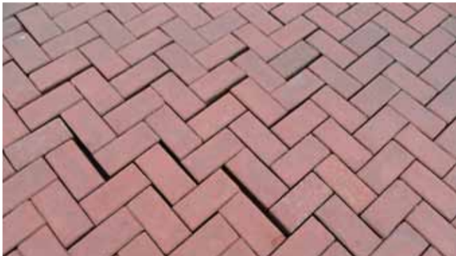
Stenen liggen los en klapperen. Deze foto is gemaakt bij de hoek Dijkstraat – Zeewijkensingel. In de Haaksbergenstraat ligt ook een heel "klapper" stuk.

is dat de straten mooi opgeknapt zijn maar wanneer je goed kijkt zie je veel tekorten. Er is heel veel breuk in de stenen. Er zijn delen waar de stenen klapperen of wijken. In de Braamstraat zijn in de trottoirs al heel wat verzakkingen. Dat kan anders. Wanneer je naar de Oude Waterlaan kijkt zie je deze gebreken niet. Deze straat, die een aantal jaren eerder opgeknapt is, ligt er nog mooi bij.