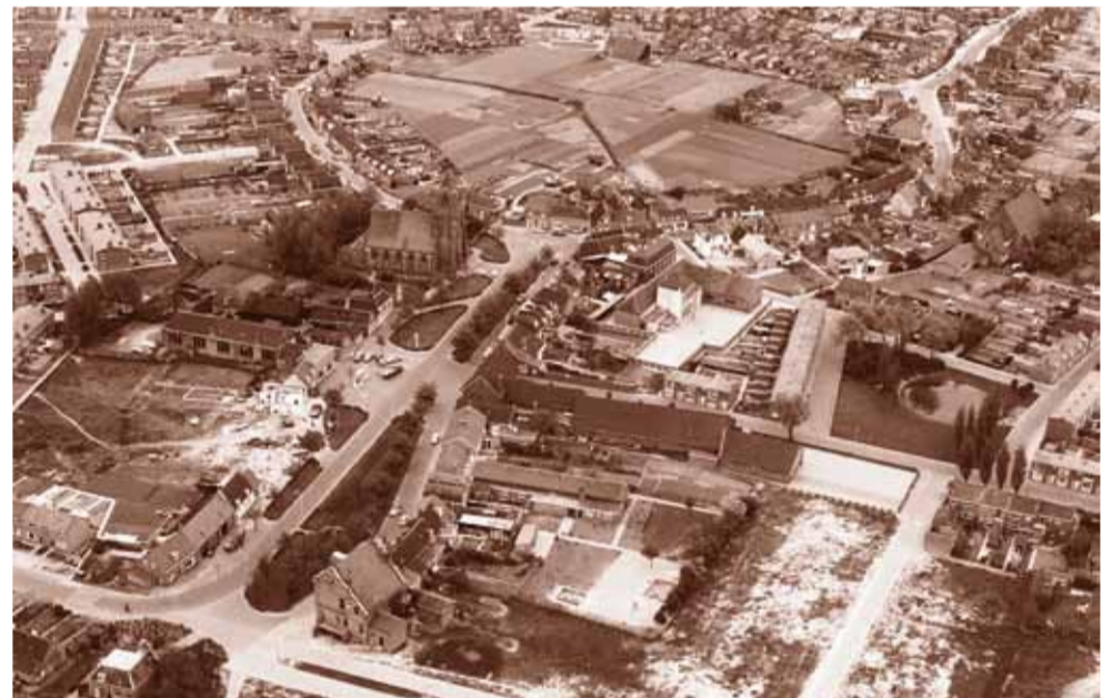
11-05-1964 op de voorgrond de eerste contouren van de Burgemeester Stemerdinglaan.

De gemeente Vlissingen hecht er veel waarde aan dat omwonenden, gebruikers en overige belangstellenden meedenken over de inrichting van de Burgemeester Stemerdinglaan. In april organiseert de gemeente een inloopbijeenkomst waar het voorlopig ontwerp gepresenteerd wordt. Omwonenden krijgen schriftelijk bericht over de datum en plaats van de bijeenkomst. Verder zal in de gemeentelijke informatiepagina Blauw geruite kiel (in de Vlissingse Bode) een aankondiging voor de inloopbijeenkomst geplaatst worden. Tijdens de inspraakperiode is er gedurende zes weken gelegenheid om te reageren op het voorlopig ontwerp.