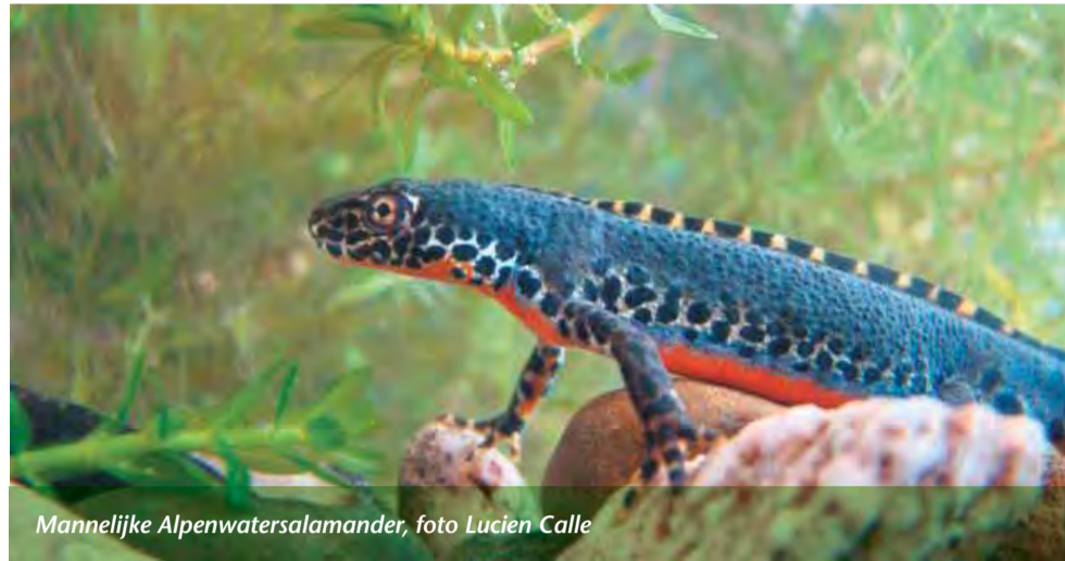
Mannelijke Alpenwatersalamander

De Alpenwatersalamander is een prachtig dier dat vooral bekend is van de zandgebieden in oost en zuidoost Nederland. In de zeelegebieden in het westen van het land is deze soort uiterst zeldzaam. Meestal gaat het in die kleigebieden niet om populaties, maar om solitaire dieren die door gesleep met planten onbedoeld op een plek buiten het natuurlijke verspreidingsgebied terecht zijn gekomen.