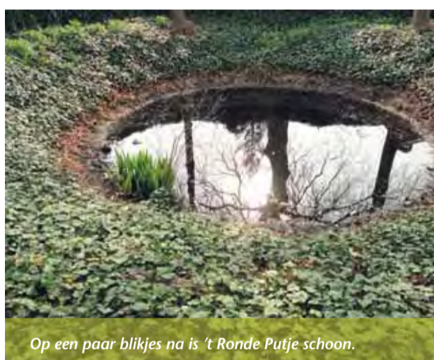
Op een paar blikjes na is 't Ronde Putje schoon.

In de Souburgsche Courant van afgelopen april deed ons melkmeisje een oproep om wat te doen aan haar monument en aan het plastic afval in het Ronde Putje.