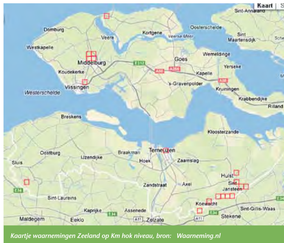
Kaartje waarnemingen Zeeland op Km hok niveau

Wanneer de gemeente Vlissingen en de woningbouw verenigingen nu geen maatregelen nemen dan is er over vier jaar een groot gebrek aan huurwoningen!