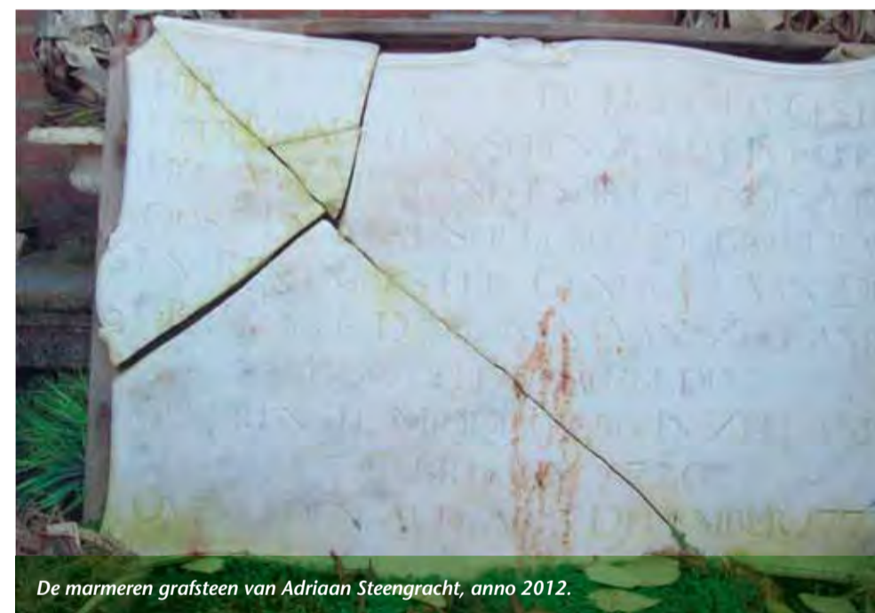
De marmeren grafsteen van Adriaan Steengracht, anno 2012.

Bij werkzaamheden op het kerkhof van West-Souburg in de eerste week van 1912, stuitte enkele werklieden op een onverwachte vondst: een marmeren grafsteen van ene Adriaan Steengracht, bij leven - zoals de grafsteen vermeldde - Heer van Moyland en Till, Slangenburg en Oost- en West Souburg. De vondst haalde de krant, maar raakte daarna weer snel in vergetelheid. Meer dan een eeuw later zou dezelfde grafsteen weer opduiken (zie kadertekst). De steen is in 2012 niet meer zo mooi, behoorlijk beschadigd en vuil, maar het maakt het object niet minder intrigerend. Wie was deze Adriaan Steengracht?