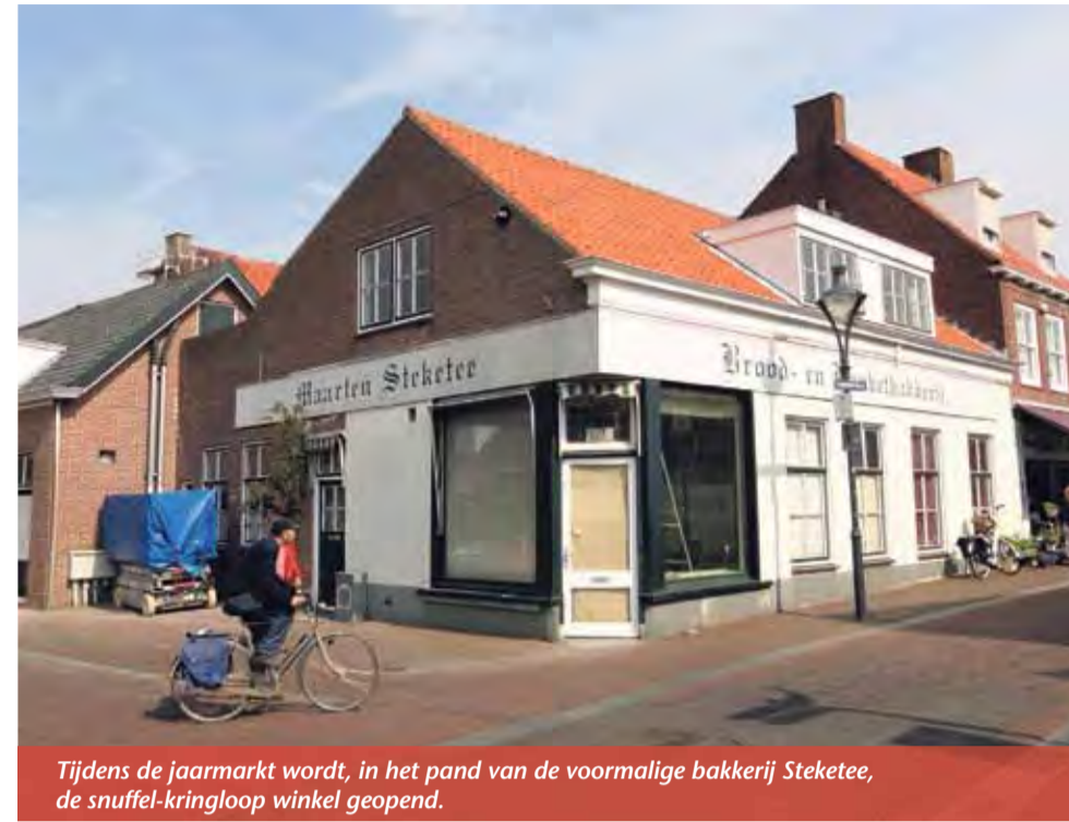
Tijdens de jaarmarkt wordt, in het pand van de voormalige bakkerij Steketee, de snuffel-kringloop winkel geopend.

U hebt het inmiddels vast wel al gezien. Aan de Kanaalstraat / hoek Paspoortstraat is na vijf jaar leegstand een nieuwe bestemming gevonden voor de oude bakkerij van Steketee. Er is zelfs een geheel nieuwe ruime toegang gecreëerd, naast de Primera. Achter deze deuren bevindt zich de geheel vernieuwde snuffelwinkel / kringloopcentrum van een jonge enthousiaste ondernemer. Hij wil de inwoners van Oost-Souburg, maar het liefst ook ver daarbuiten, voor een lage acceptabele prijs goede bruikbare producten en materialen aanbieden, die nog zeker voor een tweede leven in aanmerking komen. In deze tijden van crisis en recessie is hier zeker een goede markt voor. En van deze opbrengsten zal hij ook nog een goed doel steunen.