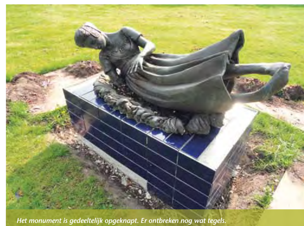
Het monument is gedeeltelijk opgeknapt. Er ontbreken nog wat tegels.

Op verschillende plaatsen waren er tegels losgekomen van het monument. En het Putje lag vol plastic afval. Gelukkig wordt op dit moment het monument opgeknapt en ook is het plastic afval uit 't Ronde Putje verwijderd. Er liggen alleen nog wat limonade en bier blikjes. Dat laatste is tegenwoordig moeilijk te voorkomen. Een deel van de jeugd gooit zijn afval overal. Deze rommelmakers zouden het verhaal van 't Melkmeisje eens moeten lezen. Ze kunnen in dit verhaal lezen dat verkeerd gedrag uiteindelijk gestraft wordt.